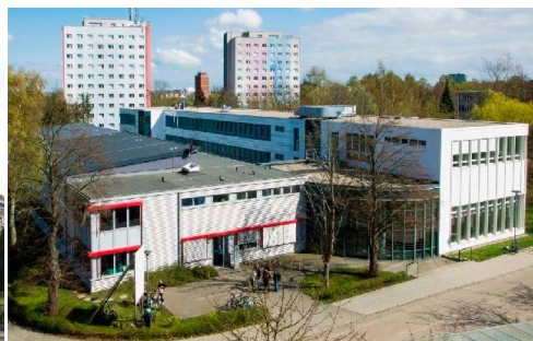
REFA-Labor im Fraunhofer-Institut für Großstrukturen in der Produktionstechnik IGP

18055 Rostock Lange Straße 1a - 4. Etage