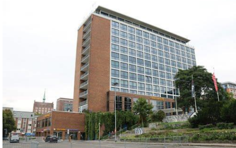
REFA Mecklenburg-Vorpommern Geschäftsstelle Rostock

18055 Rostock Lange Straße 1a - 4. Etage