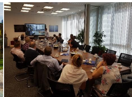
REFA-Arbeitskreis Industrial Engineering bei Weber Maschinenbau (Beispiel)